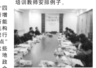
研讨会发言主题和演讲嘉宾如下:

部培训的重点不是知识的传授,而是帮助干部提炼工作经验,寻找研究问题、解决问题的思路、实用方法和解决这些问题的他人的实际经验。这就对从事干部教育培训的教师提出了与学历教育不同的要求。干部培训项目,应有三支教师队伍组成:一是高校的教师,但其应从事过有关问题的实证研究,特别是参加过上海市政府决策咨询项目,二是相关领域内既有实际经验、又有理论研究的领导干部,三是政府的智囊团成员。此次研讨会的演讲嘉宾就是一个很好的干部教育培训教师安排例子。