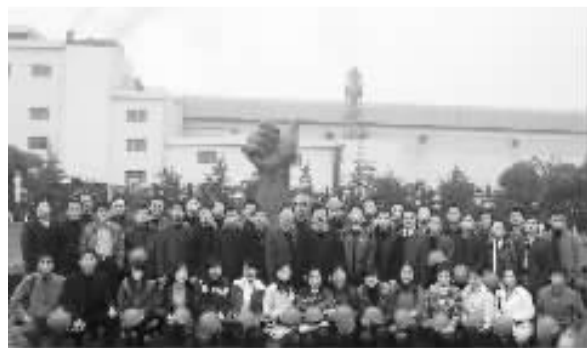
济宁班学员参宝钢

四个半月的集体生活,让我结识了来自全市各地不同单位的同学。为了一个共同的目标,我们走到了一起,互相关心,互相帮助,共同学习,共同进步。课堂上我们认