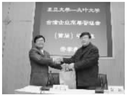
复旦-大叶大学企业高层管理者研修班

短短两天的学习交流结束了,两所高校的合作在此次培训班中开了个好头,相信以后会有更多的交流和学习。◆周丹