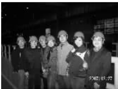
济宁班上海企业行活动

处长首先向学员介绍了化工区成立的历史、规模、招商引资状况、一体化生产的理念等,并向学员介绍建立和管理一个工业园区需要考虑的因素。学员们认真听讲,吸取经验。很多学员结合自己的工作实际向两位领导提出切实的问题,得到了领导的耐心解答,学员普遍表示受益匪浅。接下来,学员们在陈处长的带领下,参观了现场园区,学员们不禁为几家世界大型化工企业的规模折服,对园区的统一规划统一治理表示认可,对先进的管理生产模式表